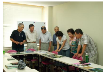
ミーティング風景