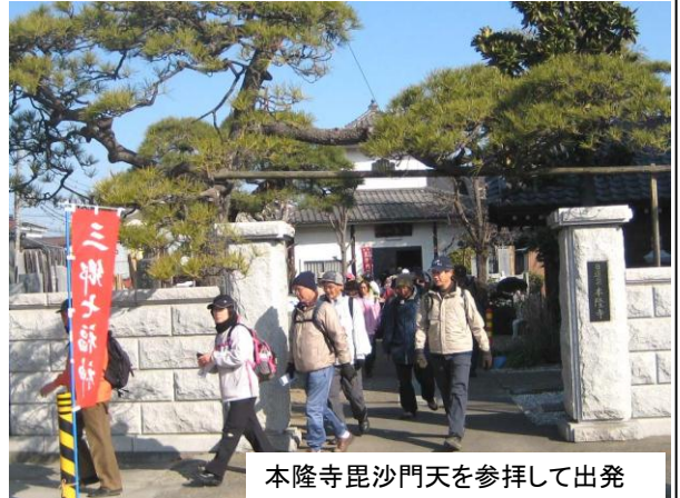
本隆寺毘沙門天を参拝して出発

さて当日は無風の晴天に恵まれ173名(役員19名)の方にご参加頂いた。短コースでやめてバスで帰られた