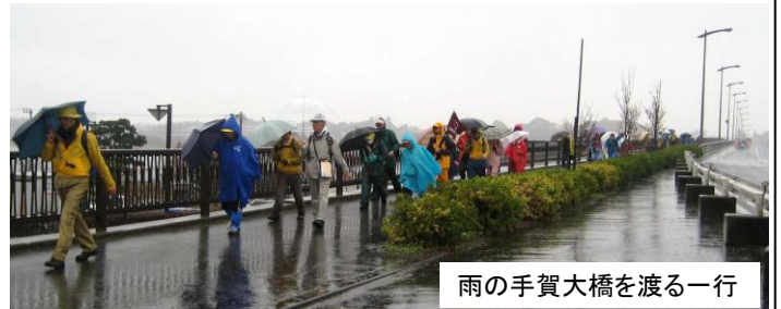
雨の手賀大橋を渡る一行

ショートカットを実施し、手賀大橋の下での昼食と相成り、情けなく存じました。されど参加者の皆様と役員ともども元気良くゴール地点に到着しました。無事なる事を感謝しております。雨天にもかかわらずご参加下された皆様はじめ役員の方々にご協力を賜り、有難う御座いました。(担当:中村・早川・遠藤)