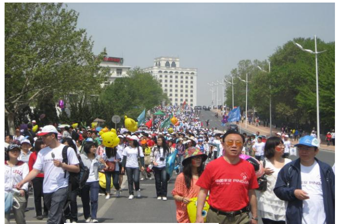
13万人の人、人、人の波

第13回大連アカシアマーチは2011年5月21～22日に開催され、私は3回目の参加になります。大会初日の参加者が13万人と発表され、何時も圧倒されます。私は2年ぶりの参加で気付いたことは経済発展が著しく、高層ビルが増えたこと。そして参加者の服装がウォーキングというスポーツに適したスタイルに変わっていた事です。