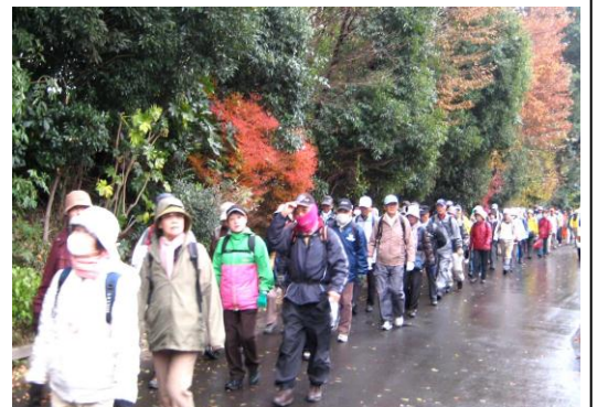
南柏の野馬土手を見学する参加者