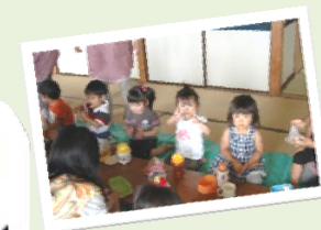
↑ママのお勉強を応援する子どもたち