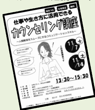
←2009 事業 「人間関係をスムーズにするカウンセリングスキル」