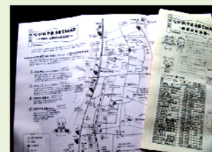
↑2009 事業：ごほうび講座終了生有志による「MAPプロジェクト」との連携事業