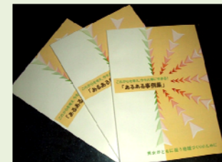
↑2006 事業「流山市民活動団体による「MAPプロジェクト」との連携事業 公益事業補助金制度」認定事業