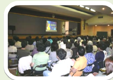
←2008 事業 「おひとりさまの老後」 講師：上野千鶴子氏 300人が集いました！